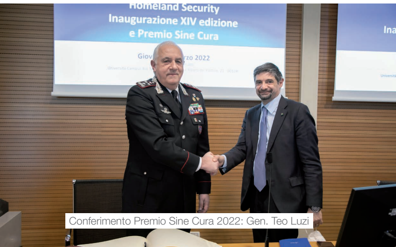
Conferimento Premio Sine Cura 2022: Gen. Teo Luzi