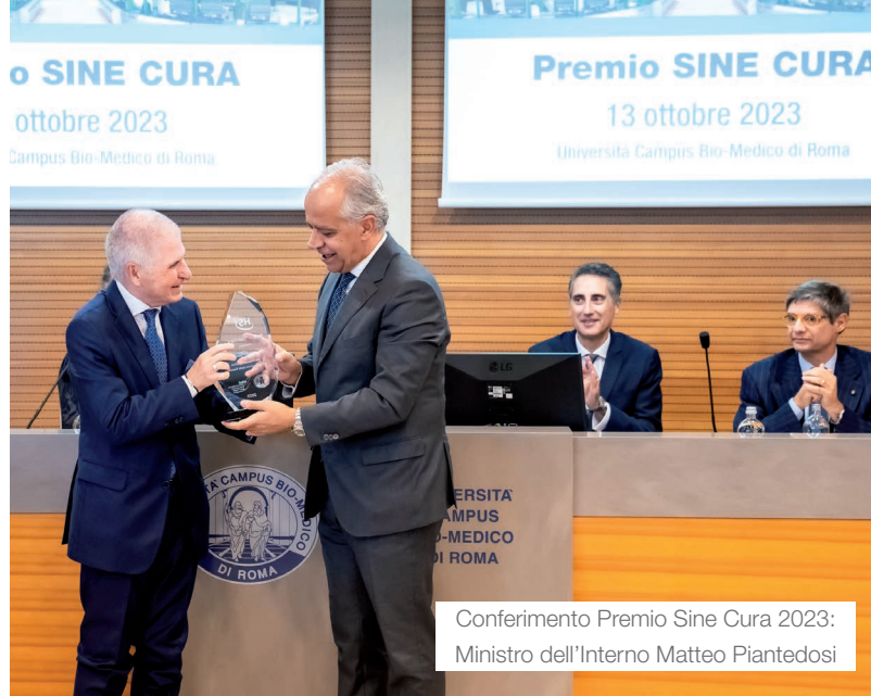
Conferimento Premio Sine Cura 2023: Ministro dell'Interno Matteo Piantedosi

Per i professionisti già occupati nel settore della sicurezza, il Master offre l'opportunità per arricchire il proprio Curriculum, ampliare il network di conoscenze in un settore in grande espansione e l'occasione per una crescita lavorativa e un avanzamento di carriera.